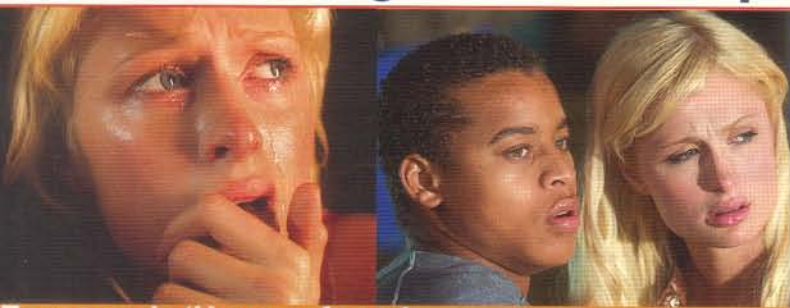
Escenas de 'House of wax'

E sta vez el encuentro fue en los estudios Warner Brothers en Burbank. Quizás porque querían mostrarnos los lugares exactos donde se realizó la filmación de 'House of wax'. En las inmensas salas se podía apreciar personajes de cera y todos los muebles que se ven en la película. Las escenas en el bosque y de naturaleza se rodaron en Australia. La película narra la